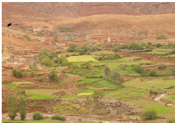
Landwirtschaft, Boden- und Wasserressourcen in der Fés-Meknès-Region.

Als Begleitforschung werden potenzielle Konflikte und Innovationen im landwirtschaftlichen Transformationsprozess analysiert.