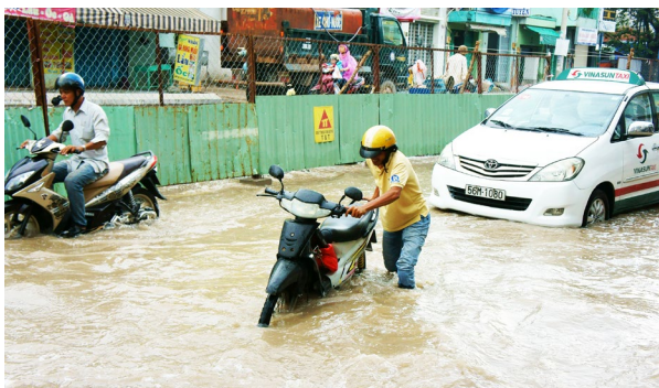
Hochwasser in Ho Chi Minh City.

Auf diese Weise kann DECIDER einen nachhaltigen Beitrag zur erfolgreichen Minderung des Hochwasserrisikos in Küstenstädten weltweit leisten. Das Projekt unterstützt somit die Umsetzung nicht nur der globalen Ziele zur Katastrophenminderung, sondern auch zur Klimawandelanpassung und nachhaltigen Entwicklung.