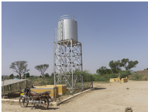
Solar-Wasserpumpen in Niger.

Mali und Gambia sind Teil der westafrikanischen Sahelzone und waren im Laufe der vergangenen Jahrzehnte extremen Klimaereignissen wie Dürren, Überschwemmungen und Hitzewellen ausgesetzt. Der Klimawandel wird mit großer Wahrscheinlichkeit tiefgreifende Auswirkungen auf die Ernährungssicherheit sowie die allgemeine regionale Stabilität haben. Dies wird wiederum den Druck auf die nationalen Regierungen erhöhen, internationale Klimaabkommen einzuhalten. In weiten Teilen Afrikas steht das Energiesystem vor einer Reihe miteinander verknüpfter Herausforderungen, wie dem weitflächigen Zugang zu Elektrizität, einer Gewährleistung der Energieversorgungssicherheit sowie zunehmender Umweltzerstörung.